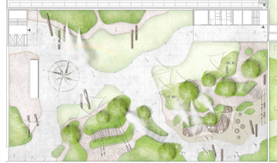
Grundriss © © DnD Landschaftsplanung