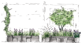
Skizzen Bepflanzungskonzept / ©DnD