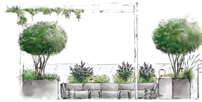
Skizzen Bepflanzungskonzept / ©DnD